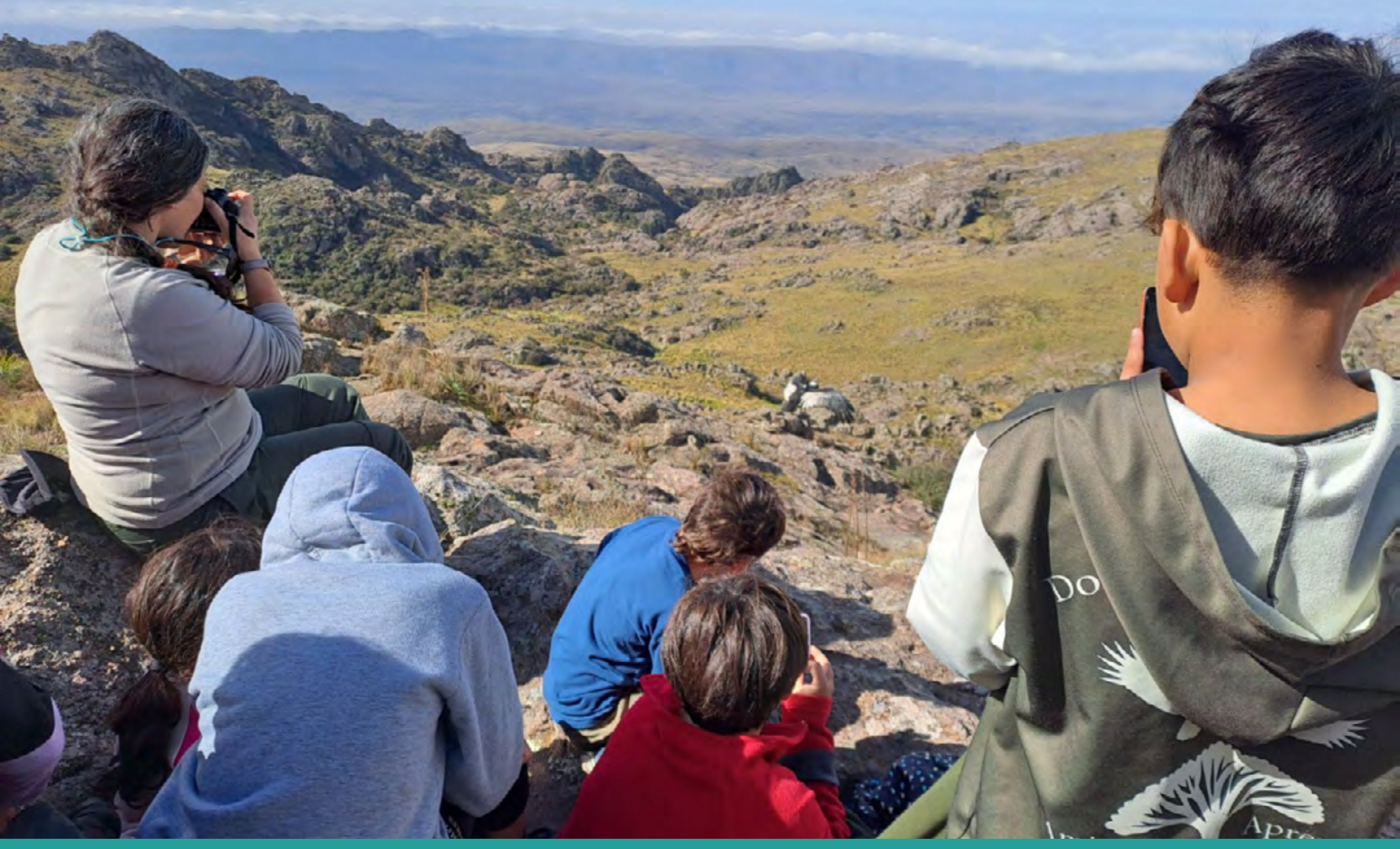
Se liberaron dos cóndores en el área protegida - PN Quebrada del Condorito.