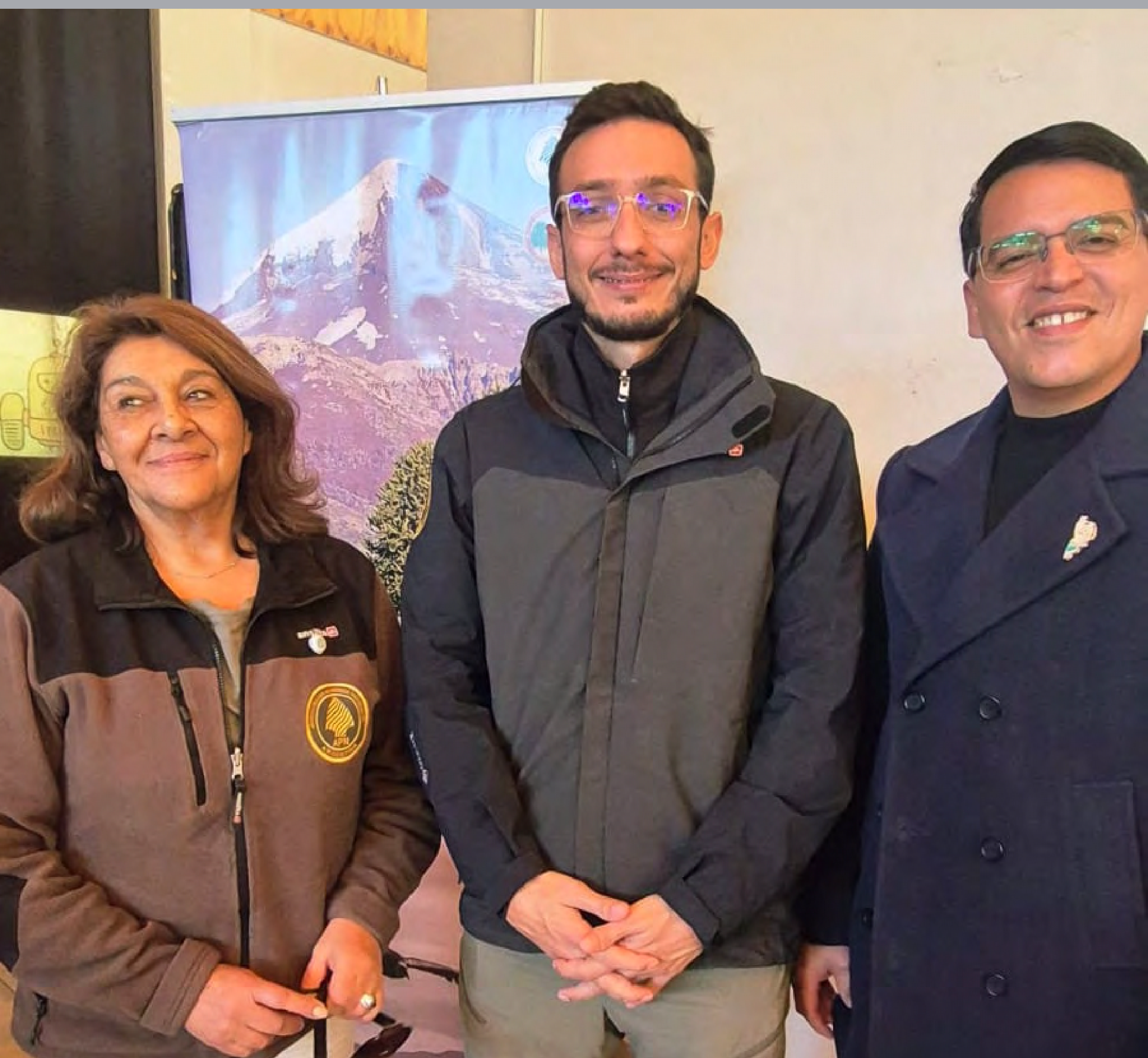
Acto por aniversario del área protegida - PN Lanín.