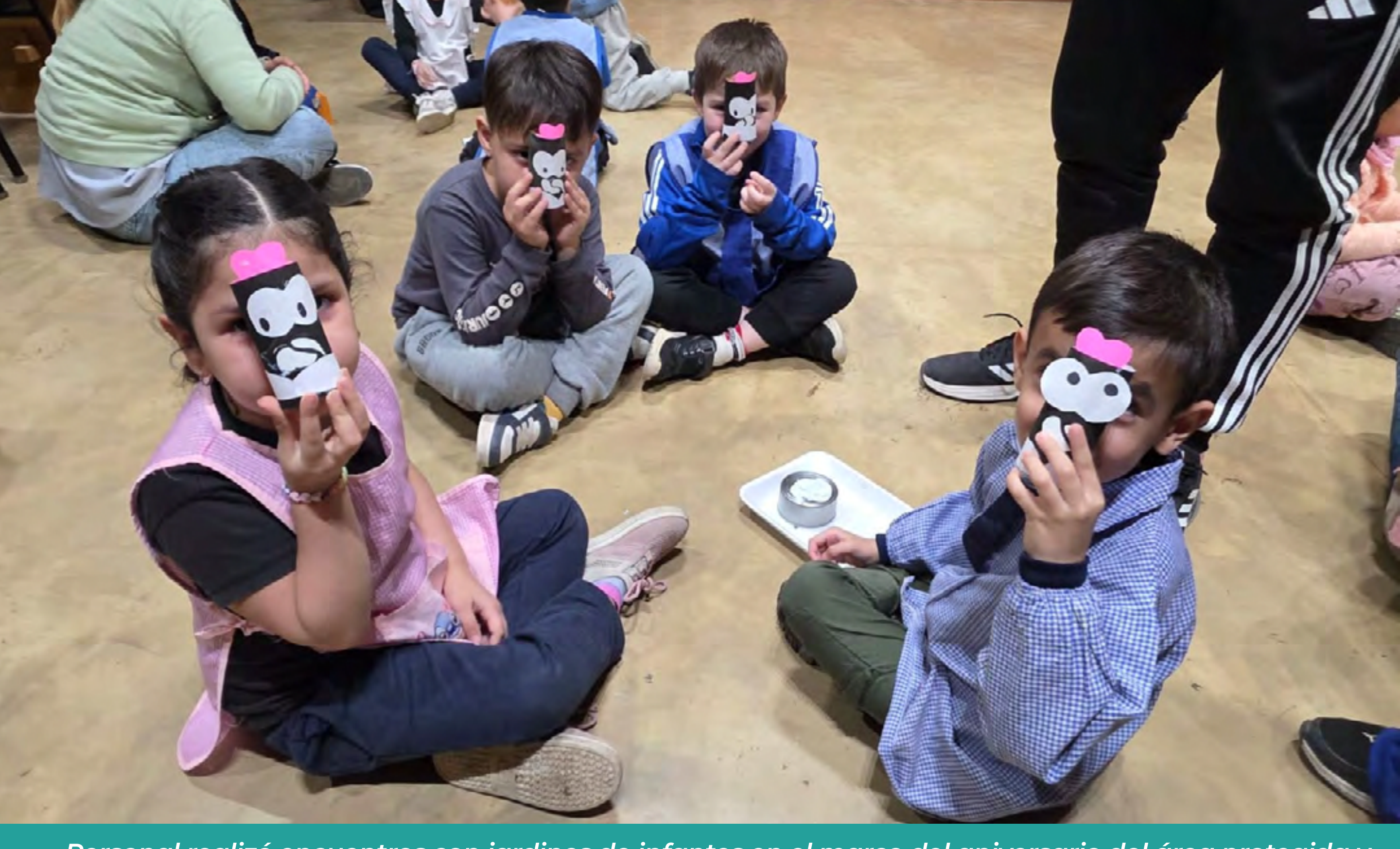
Personal realizó encuentros con jardines de infantes en el marco del aniversario del área protegida y del Día del Combatiente de Incendios Forestales - PN Los Glaciares.