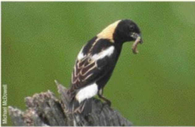
Charlatán macho con una isoca en el pico.

Junto a otros parientes de los tordos, los charlatanes suelen visitar arrozceras y otros cultivos, donde descansan y obtienen alimento.