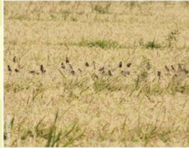
Bandada de charlatanes asentados en el arroz.

En Sudamérica, entre diciembre y abril, el Charlatán habita tanto pajales y bañados como sembradíos de sorgo, soja, girasol y arroz. Particularmente llega a los cultivos de arroz en su período de "grano lechoso". No sólo consumen el grano, también gran cantidad de insectos y larvas (isocas) y otras plantas (incluso malezas de cultivos).