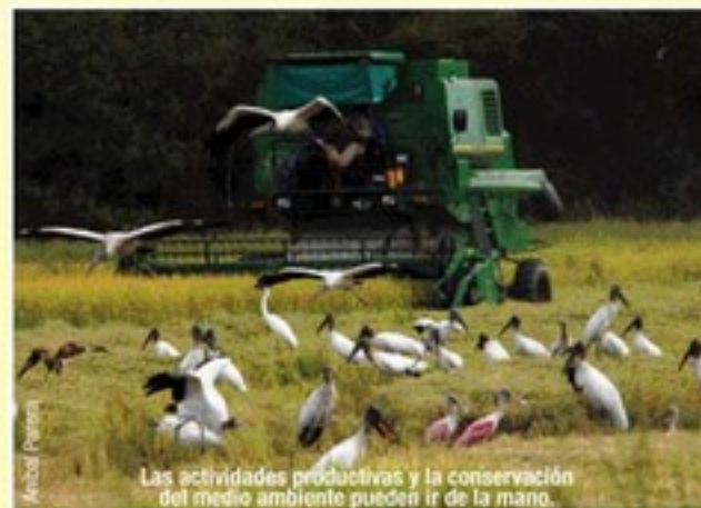
Las actividades productivas y la conservación del medio ambiente pueden ir de la mano.