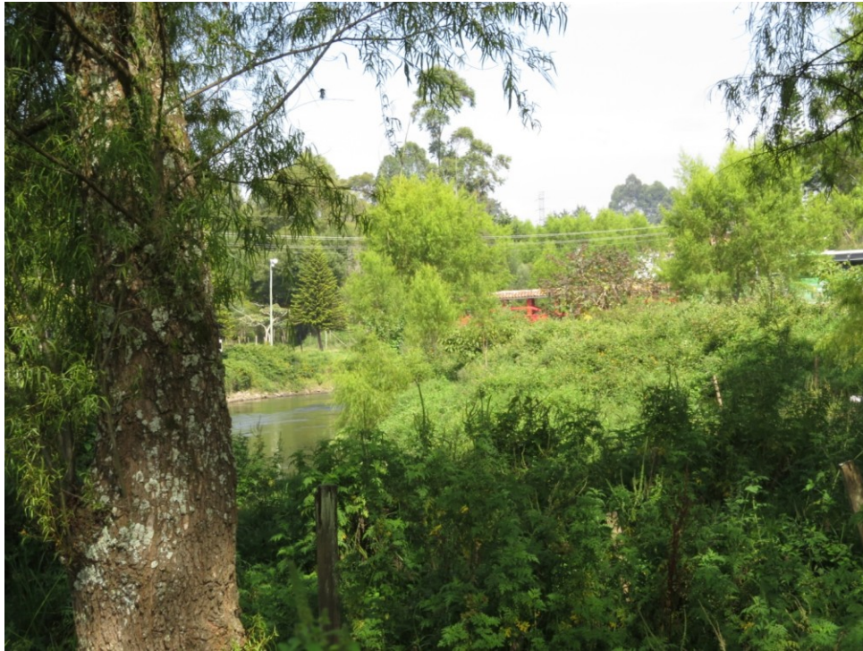
Figura 5. El Humedal Liborio Mejía en el departamento de Antioquia, una de las nuevas localidades donde se realizó el CNAA 2014