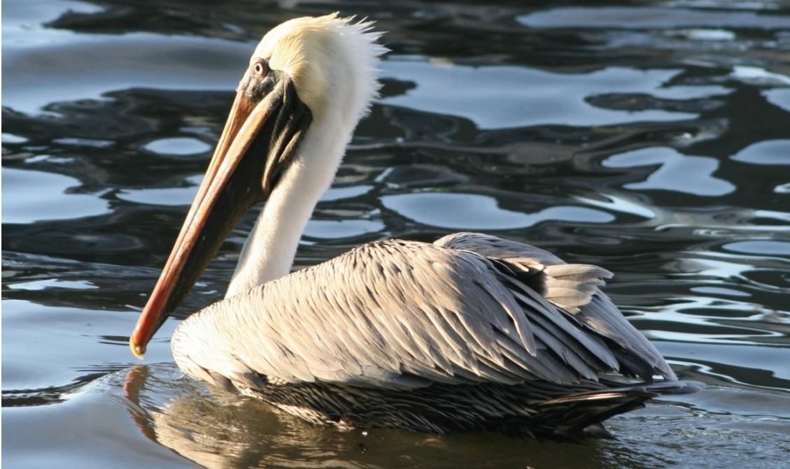
Figura 4. Individuo adulto y en plumaje reproductivo de Pelecanus occidentalis.