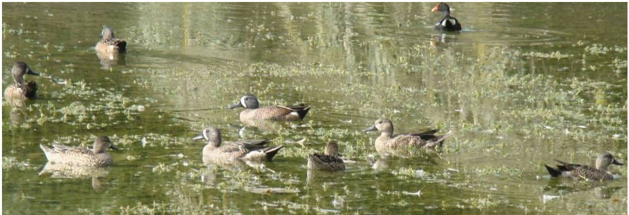
Figura 2. Grupo de Anas discors en las Lagunas del Centro Internacional de Agricultura Tropical–CIAT (Fotografía: Yanira Cifuentes-Sarmiento. Asociación Calidris).

datos se comparan con los de la jornada de julio, fecha en la que ya ha pasado la migración, se evidencia una reducción del 70%, lo que puede indicar que la mayoría de los patos canadienses registrados en febrero son migratorios (Figura 2).