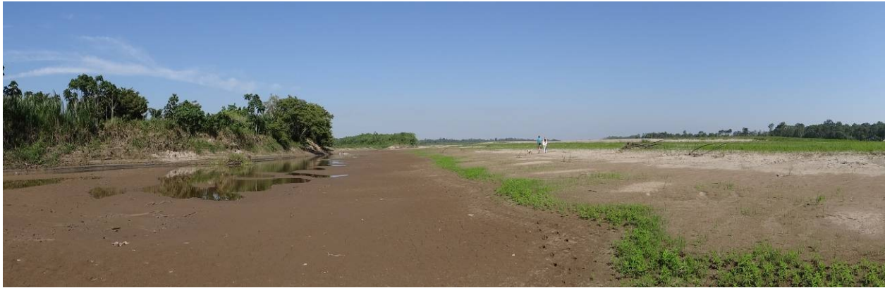
Figura 3. Playas de la cuenca media del río Guaviare