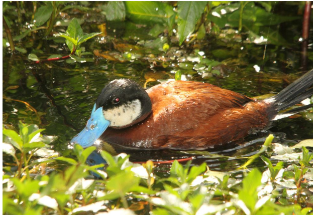
Oxyura jamaicensis (macho) en el Humedal Santa María del Lago.

Para esta jornada se obtuvo un total 1.922 registros pertenecientes a 25 especies y 12 familias. La Focha Fulica americana fue la especie más abundante con el 37% del total de registros. La familia Rallidae fue la