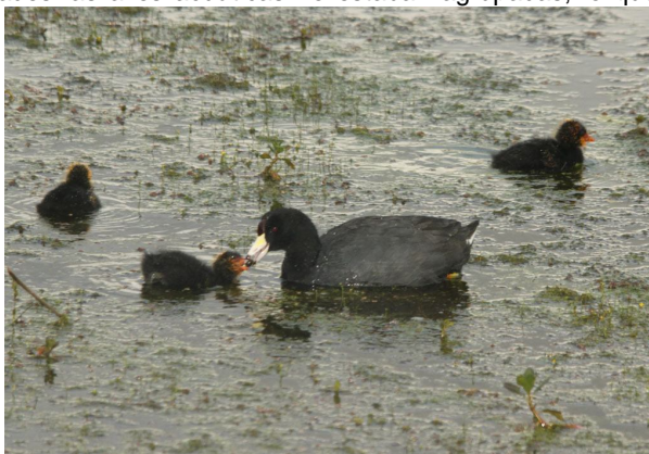
Fulica americana (hembra y polluelos) en el Humedal Santa María del Lago.

En esta jornada se incluyeron seis localidades de humedales de interior, una de las cuales hace parte del PNN Cocuy, la participación sigue siendo activa; sin embargo, varias localidades no fueron visitadas en esta jornada. Como algo para resaltar, esta segunda jornada estuvo acompañada de lluvias y en algunos casos de inundaciones, por lo que en algunas localidades las aves acuáticas no estaban agrupadas, lo que se refleja en sus abundancias. Sin embargo, varias especies aprovecharon esta situación en su reproducción y fue así que se observaron huevos y polluelos de: Dendrocygna autumnalis , D. viduata , Oxyura jamaicensis , Podilymbus podiceps , Egretta caerulea , Fulica americana , Gallinula chloropus y Jacana jacana .