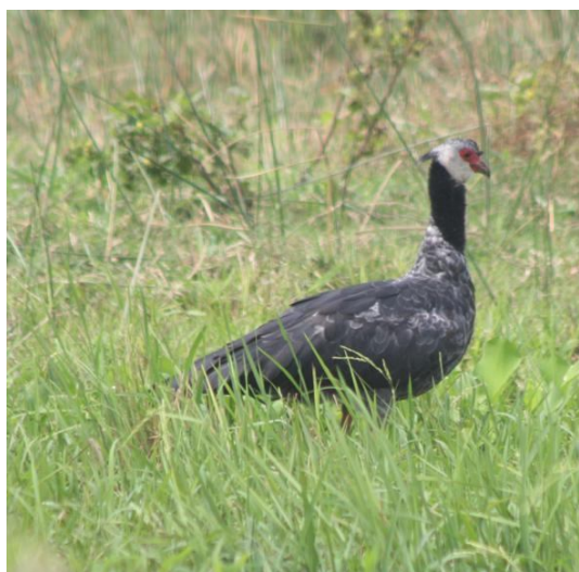
Chauna chavaria en Córdoba.

Con respecto a las especies Dendrocygna autumnalis (7.515), Phimosus infuscatus (2.115), Dendrocygna bicolor (2.177) y Leucophaeus atricilla (1.306) fueron las especies con el mayor número de individuos. Se observaron 28 especies de aves migratorias, sobresaliendo Leucophaeus atricilla (1.306) y Anas discors (1.153) con los mayores números de individuos registrados.