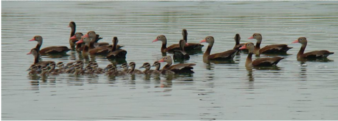
Dendrocygna autumnalis . Adultos y polluelos en las Lagunas del CIAT.

Para la temporada de julio se visitaron 15 localidades, se obtuvo en total 3.411 registros de 20 familias y 43 especies. La familia Ardeidae con 940 individuos y siete especies fue la más abundante y la familia con mayor riqueza. El Coquito Phimosus infuscatus fue la especie más abundante con 758 registros. El Ibis pico de Hoz, las Tringas patiamarillas y el Pato Canadiense fueron las únicas especies migratorias reportadas para esta jornada, de las cuales Plegadis falcinellus con 17 individuos fue la especie migratoria más abundante.