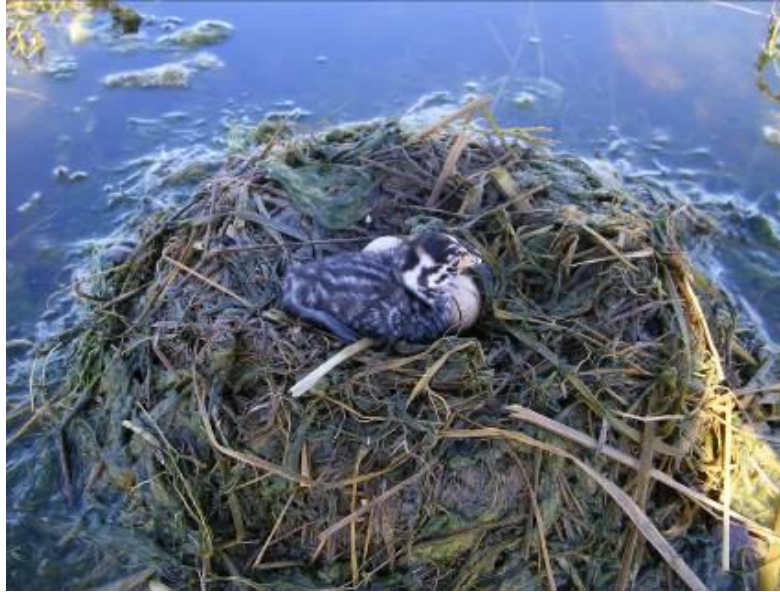
Podilymbus podiceps : nido con huevo y pichón encontrado en Laguna Buena Vista, Chaco Central.