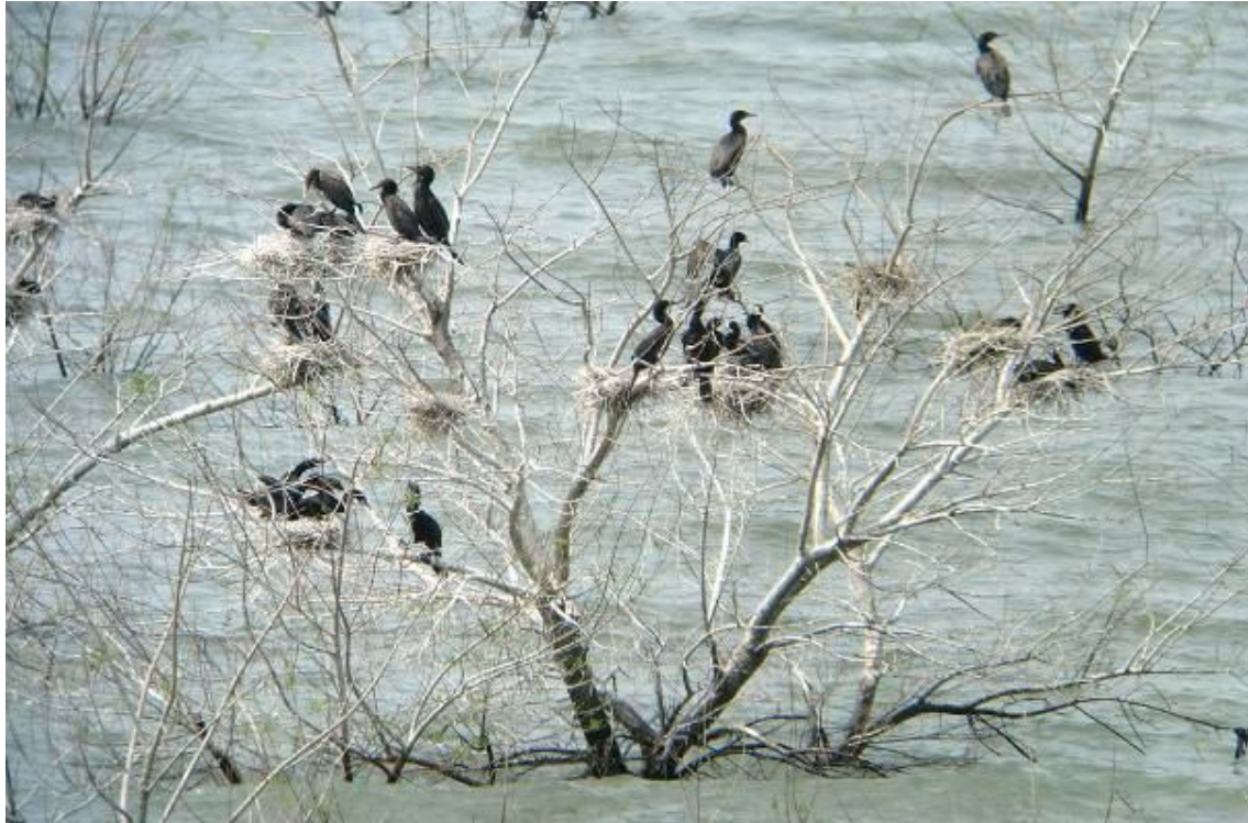
Colonia de Phalacrocorax brasilianus , Isla Yacyreta. (Silvia Centrón)